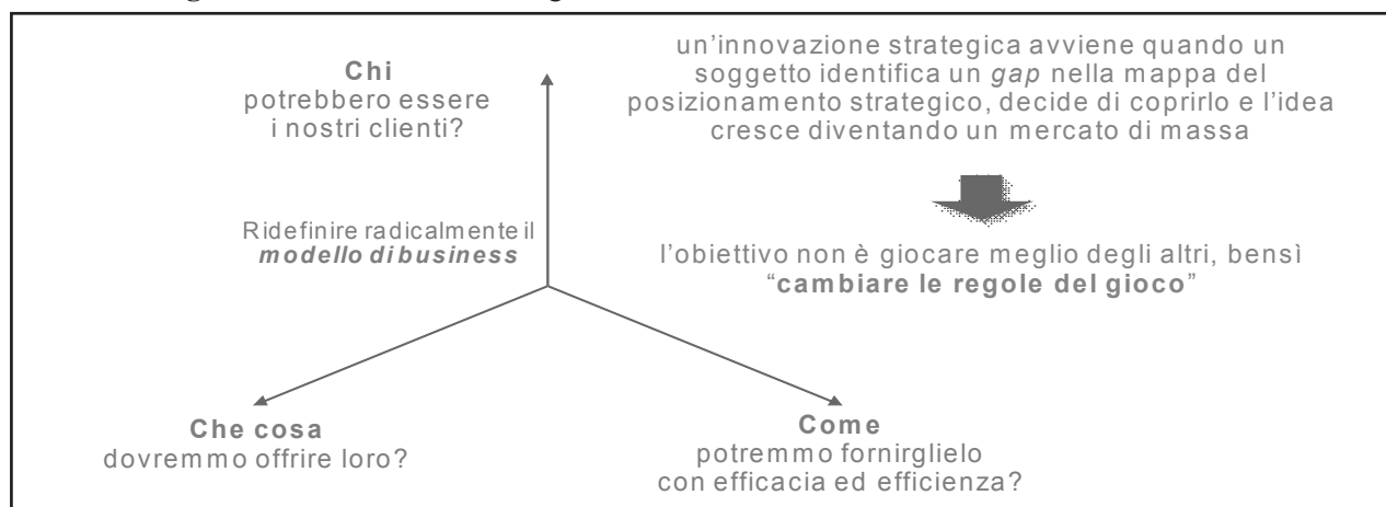
Figura 1. L'innovazione strategica come ridefinizione radicale del modello di business

Tutte queste soluzioni, per quanto condivisibili e curiosamente simili a quelle tradizionalmente proposte alle PMI - appaiono però parziali. L'evoluzione discontinua del contesto competitivo dei servizi professionali sembra infatti imporre ai PMS - similmente a (e in conseguenza di) quanto avviene per i loro clienti - lo sviluppo di processi di innovazione strategica partendo dai punti di forza a loro riconosciuti: competenza tecnica, prossimità/tempestività e rapporto fiduciario. Questi building blocks degli attuali modelli di business dei PMS possono infatti costituire i punti da cui partire per sviluppare un'innovazione strategica.